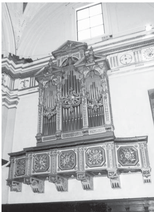
Organo "Mascioni" 1959