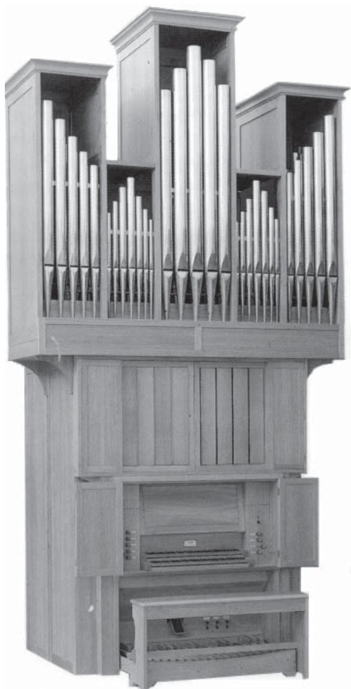
Organo "Pinchi" op. 395 1992