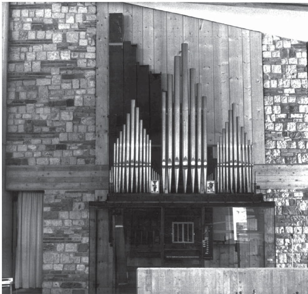
Organo "Fedeli" metà XVI sec.