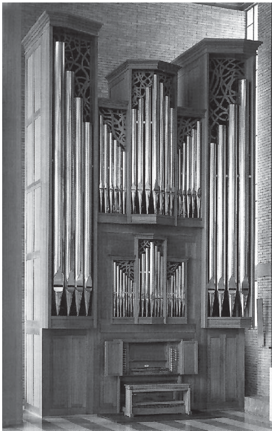
Organo "Pinchi" op. 398 (1993) Parrocchia B.V.M. della Misericordia